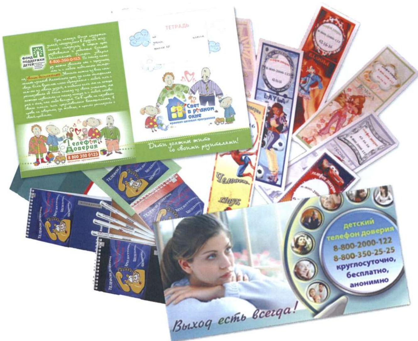
Примеры размещения рекламы детского телефона доверия на канцелярских принадлежностях

Более чем в 50-ти регионах проводятся масштабные региональные акции «Скажи телефону доверия «ДА!», «Давай с тобой поговорим!», «Сделай шаг к безопасности!» и др., в ходе которых сотрудники служб и волонтеры раздают детскому и взрослому населению карманные календари, буклеты, информационные листки с номером детского телефона доверия.